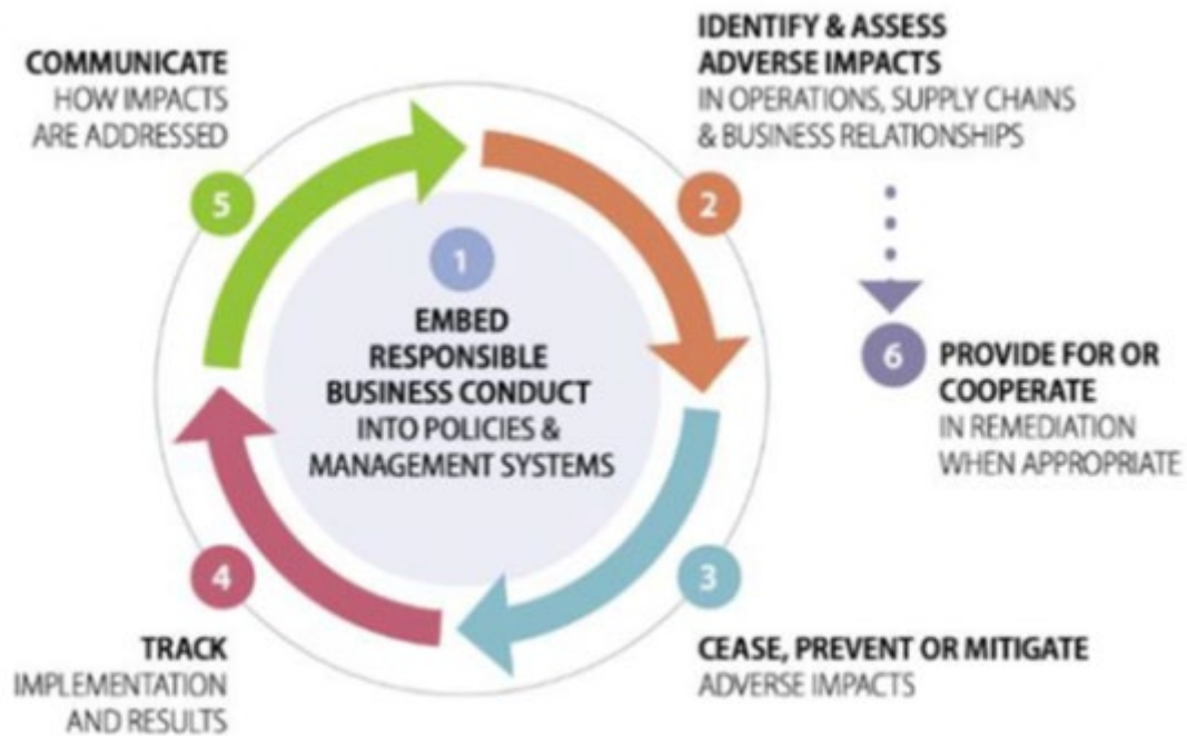
FIGURE 1. DUE DILIGENCE PROCESS & SUPPORTING MEASURES