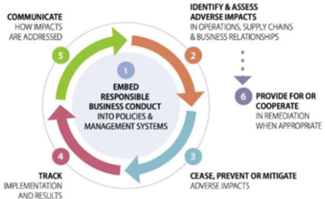
FIGURE 1. DUE DILIGENCE PROCESS & SUPPORTING MEASURES